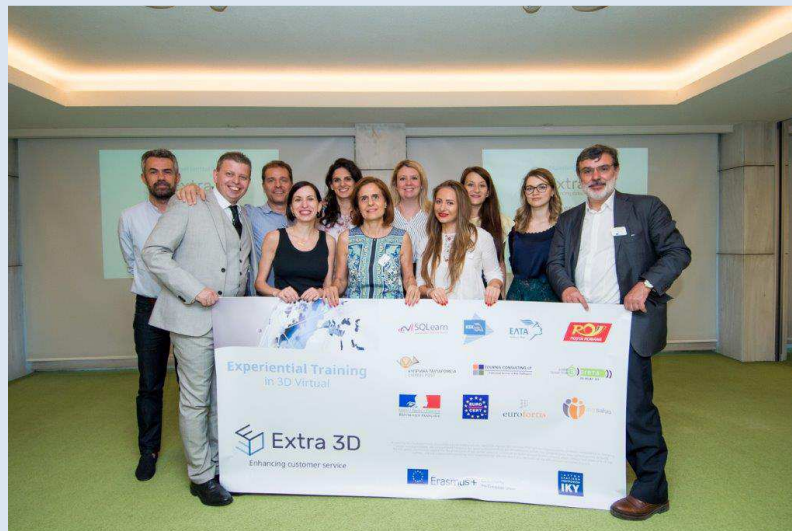
Τελική Εκδήλωση- Αθήνα, 31.05.2018