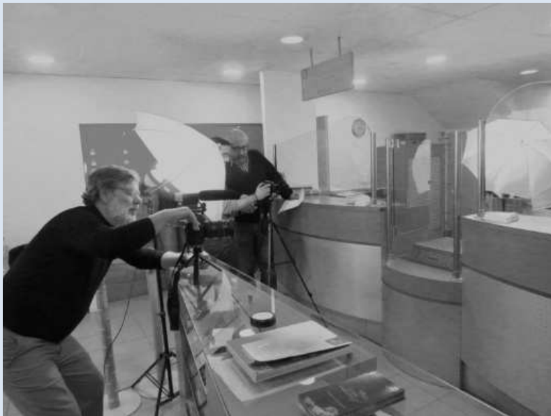
Σκηνή από το γύρισμα των εκπαιδευτικών σεναρίων/videos