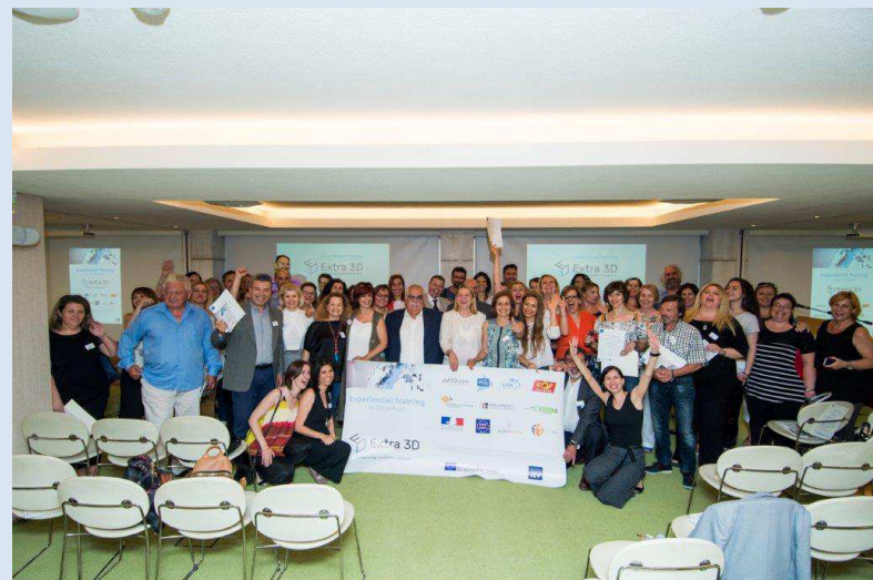
Τελική Εκδήλωση- Αθήνα, 31.05.2018