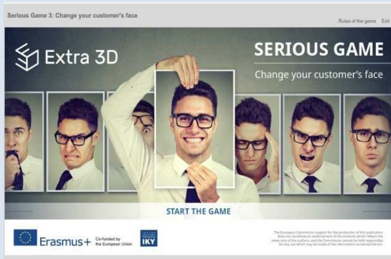
Serious Game στην πλατφόρμα του Έργου