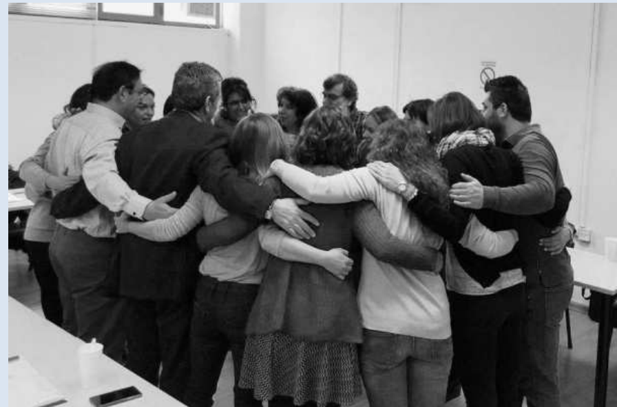
Η Ομάδα των facilitators του Έργου

ΕΛΤΑ / Διεύθυνση Στρατηγικής & Ανάπτυξης Τομέας Συγχρηματοδοτούμενων Έργων & Προγραμμάτων Σταδίου 60, 101 88, Αθήνα Τ: 210 3353299 E: gr_stratigikis@elta-net.gr W: www.elta.gr