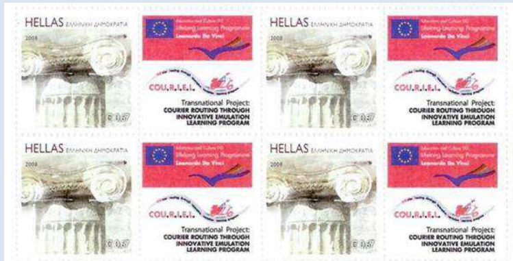
Το Προσωπικό Γραμματόσημο που δημιουργήθηκε από τη Διεύθυνση Φιλοτελισμού ΕΛΤΑ ειδικά για το Έργο.