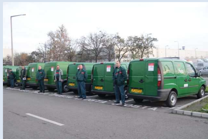
Εικόνες από την εκπαίδευση

ΕΛΤΑ / Διεύθυνση Στρατηγικής & Ανάπτυξης Τομέας Συγχρηματοδοτούμενων Έργων & Προγραμμάτων Σταδίου 60, 101 88, Αθήνα Τ: 210 3353299 Ε: gr_stratigikis@elta-net.gr W: www.elta.gr