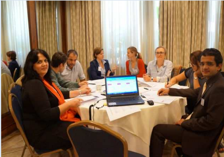
Multilateral Visit Meeting, Αθήνα, 08-10.10.2014