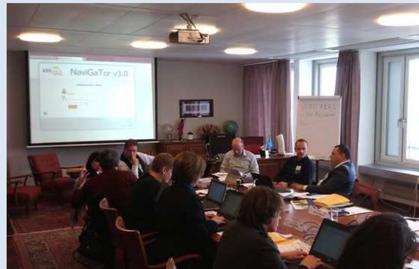
Consortium Meeting, Βέρνη, 27-29.01.2015